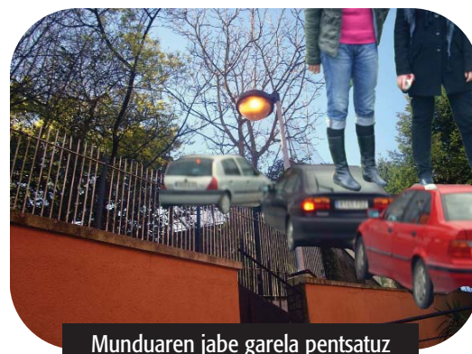
Munduaren jabe garena pentsatuz

Herrialde garatuek kutsatzen dute gehien eta gure ustez, horiek konprometitu beharko ziren gehien hori hobetzeko. Azken finean, guk azpigaratutako herrialdeek baino kezka gutxiago ditugu, edo gutxienez, beste mota batetako kezka. Adibidez: guretzat oso arrunta da "super"era joan eta gure jana prestatzea, baina beste pertsona batzuentzat ez da hain gauza erraza, eta horregatik ezin diegu eskatu beraien oinarriko beharrak asetuta ez dauzkatenei beraien lehentasuna inguru giroa izatea.