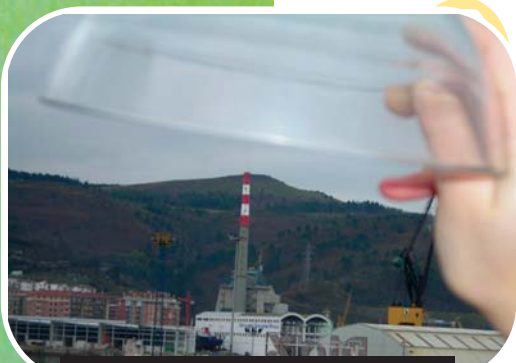
Gu: errudun eta biktimak